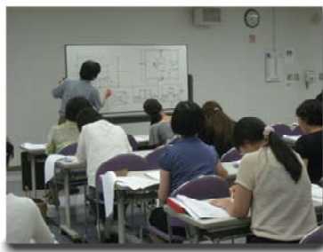
全てフリーハンドの作図は慣れれば業務でも威力を発揮しそうです。