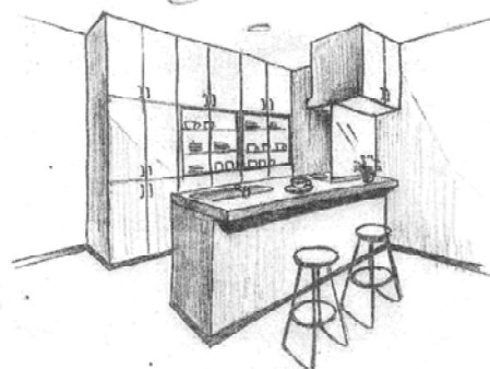
2点透視のパース(テキストより)