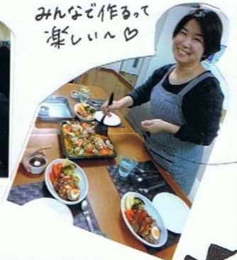
みんなで作って 楽しい♡